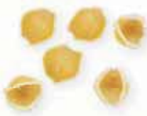
n. 32 Perline (500 g)