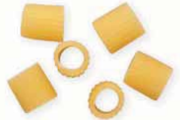
n. 31 Ditali rigati (500 g - 1 kg)