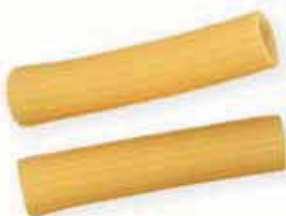
n. 43 Sedani rigati (500 g)