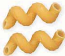
n. 44 Cellentani (500 g)