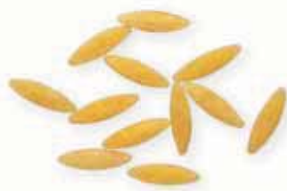
n. 14 Risone (500 g)