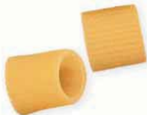
n. 135 Mezze maniche (500 g)