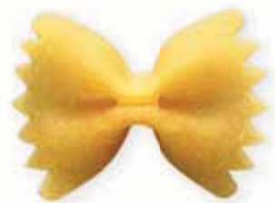
n. 70 Farfalle (500 g)