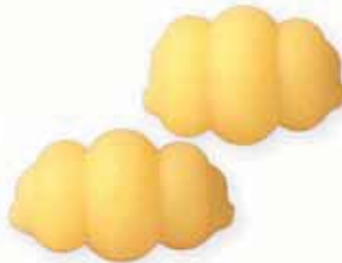
n. 63 Gnocchi (500 g)