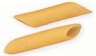
n. 57 Penne lisce (500 g - 1 kg)