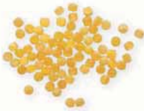
n. 11 Tempesta (500 g)