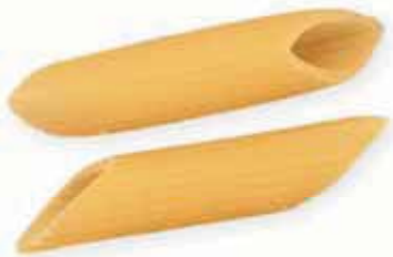
n. 59 Penne rigate (500 g - 1 kg)