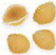
n. 33 Conchigliette rigate (500 g)