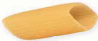
n. 60 Pennone rigato (500 g)