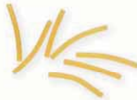
n. 77 Cerini (500 g)