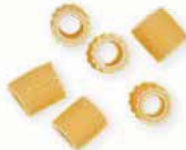
n. 28 Ditalini rigati (500 g)