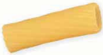
n. 52 Tortiglione (500 g - 1 kg)