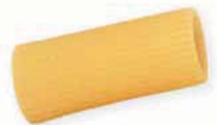
n. 51 Rigatoni (500 g)