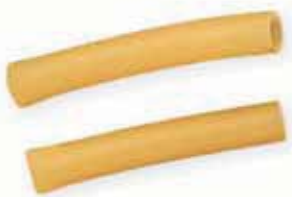
n. 124 Macaroni Coupés (500 g)