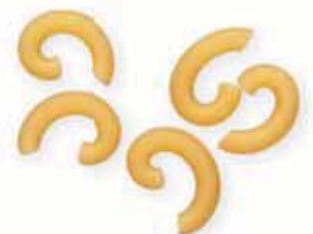
n. 139 Gramigna (500 g)