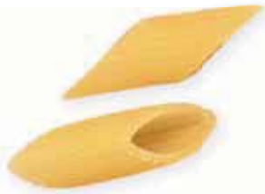
n. 55 Mezze penne rigate (500 g - 1 kg)