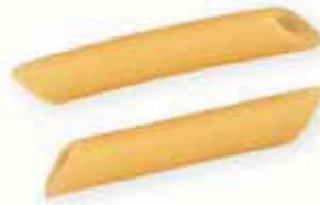
n. 56 Pennine lisce (500 g)