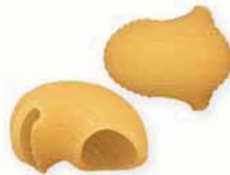
n. 49 Gomiti (500 g - 1 kg)