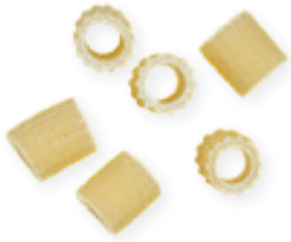
n. 28 Ditalini rigati (500 g - 5 kg)