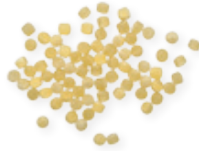
n. 11 Tempesta (500 g - 5 kg)