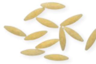
n. 14 Risone (500 g - 5 kg)