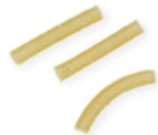
n. 38 Gramigna Coupé (500 g - 5 kg)