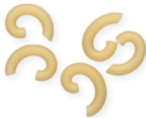
n. 139 Gramigna (500 g)