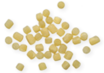
n. 12 Piombi (500 g)