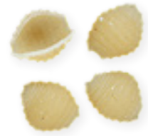
n. 33 Conchigliette rigate (500 g - 5 kg)