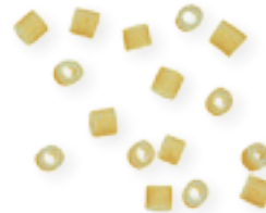
n. 18 Corallino (500 g)