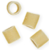
n. 29 Ditalini lisci (500 g)