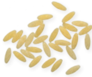
n. 13 Grana di riso (500 g - 5 kg)