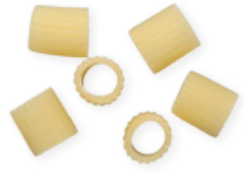
n. 31 Ditali rigati (500 g - 5 kg)