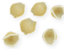
n. 32 Perline (500 g)