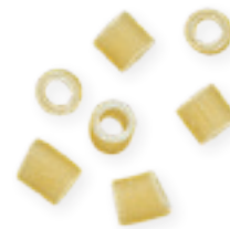
n. 26 Avemaria liscia (500 g)