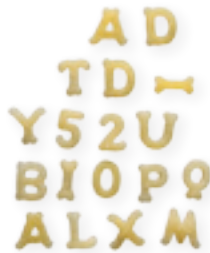
n. 210 Alfabeto (500 g)