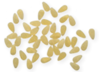
n. 15 Semi di mela (500 g - 5 kg)