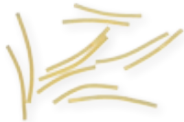
n. 179 Vermicelli Coupé (500 g)