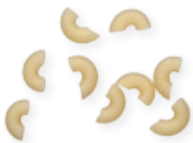
n. 138 Coquillettes (500 g)