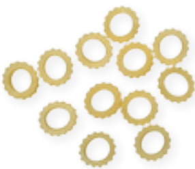
n. 21 Anellino rigato (500 g - 5 kg)