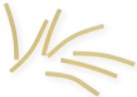
n. 77 Cerini (500 g - 5 kg)