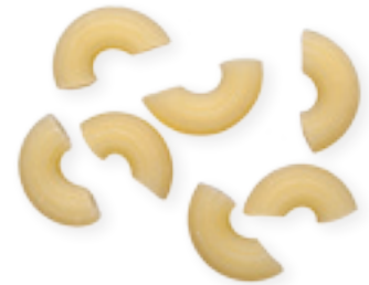
n. 40 Pipette rigate (500 g - 5 kg)