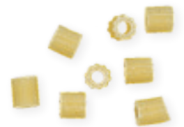
n. 27 Avemaria rigata (500 g - 5 kg)