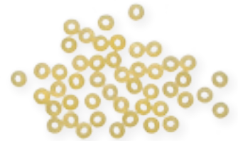
n. 19 Occhi di Pernice (500 g)