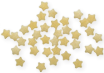
n. 16 Neve (500 g)