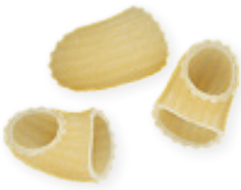
n. 30 Mezzi Chifferi