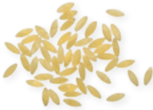
n. 115 Risino (500 g)